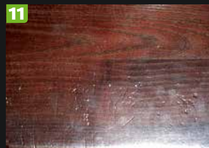
11 DREWNO JEST MATERIAŁEM STOSUNKOWO MIĘKKIM. Na stopnicach zostały ślady po pazurach psa. Deski po pewnym czasie wymagają wycyklinowania i ponownego polakierowania