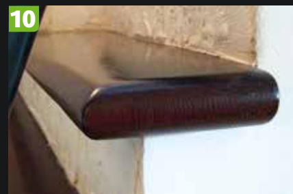
9-10 WSZYSTKIE DESKI, KTÓRYMI WYKOŃCZONO STOPNIE, MAJĄ WYOBŁONE KRAWĘDZIE. Pierwszy stopień, tzw. zapraszający, jest wysunięty i zaokrąglony